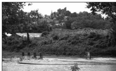
Le pont quartier St-Laurent recouvert par les eaux.